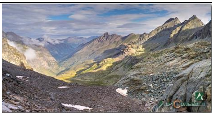
Dal Passo Vallanta m 2811, la Vallée du Guil F