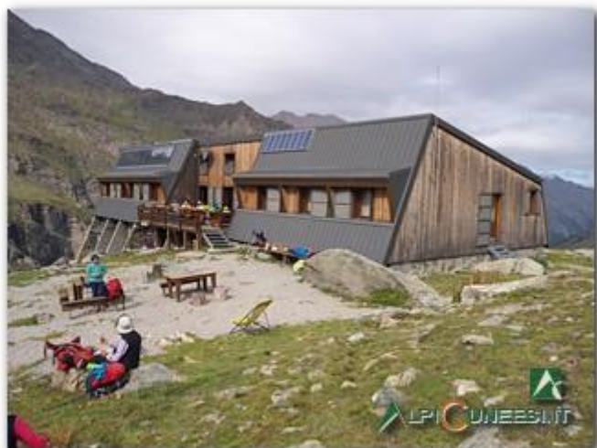
Refuge du Viso m 2460