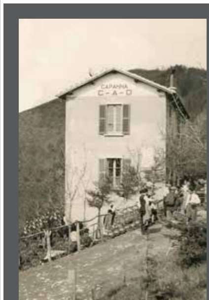
La nostra Capanna nel 1936 in una preziosa immagine dell'epoca